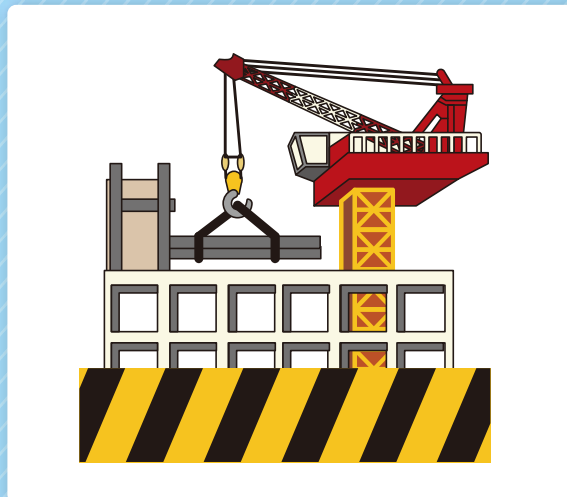
▲ 風速異常をメール配信 & 動画確認