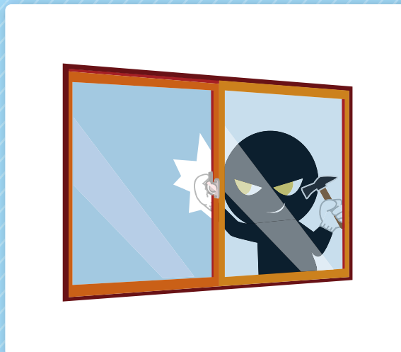
▲ 動体検知異常をメール配信 & 動画確認